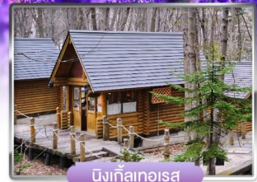
นิงเกิ้ลเทอเรซ